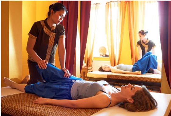
Traditionelle Thai Massage bei SU WANYO

einen Fragebogen (über unser business-Konzept und unsere Marketing-Strategie), nannten alle unsere online-Medien und social media-Kanäle und sandten Beispiele unserer Printwerbung und Auszüge aus unseren Spa-Books sowie zahlreiche Fotos von unserem Spa und den Anwendungen ein.