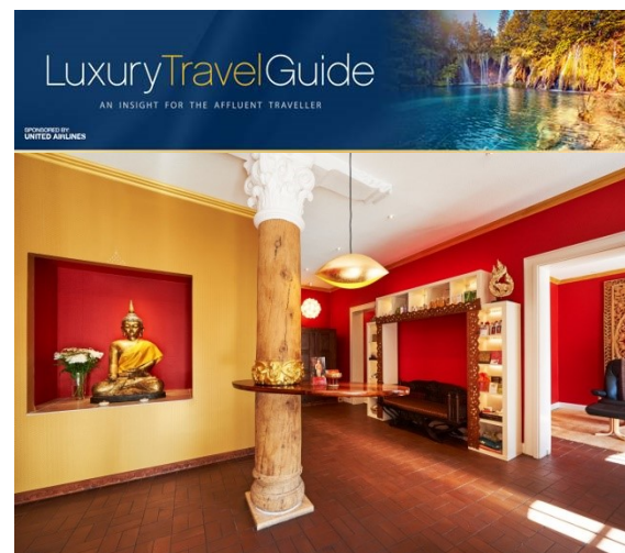
Empfangsbereich SU WANYO

Mit den Luxury Travel Awards werden weltweit herausragende Leistungen im Bereich des Destinationsmanagements, der Hospitality-Branche (Hotel, Resort, Spa, Gastronomie) und der Reisedienstleistungen (Agenturen, Tour-Operator) ausgezeichnet. Die Awards werden in vier Weltregionen vergeben (Europe, America, Asia & Australasia und Africa & Middle East). Alljährlich lädt der Luxury Travel Guide seine Leserinnen und Leser, Reisebüros, Agenturen und Manager aus der Tourismusindustrie auf der ganzen Welt ein, ihre Favoriten zu benennen, von denen sie glauben, dass sie eine Auszeichnung verdienen. Der Standort oder die Größe des Betriebes spielen keine Rolle. Irgendjemand aus dem Reisebusiness, wir wissen nicht wer, muß uns vorgeschlagen haben.