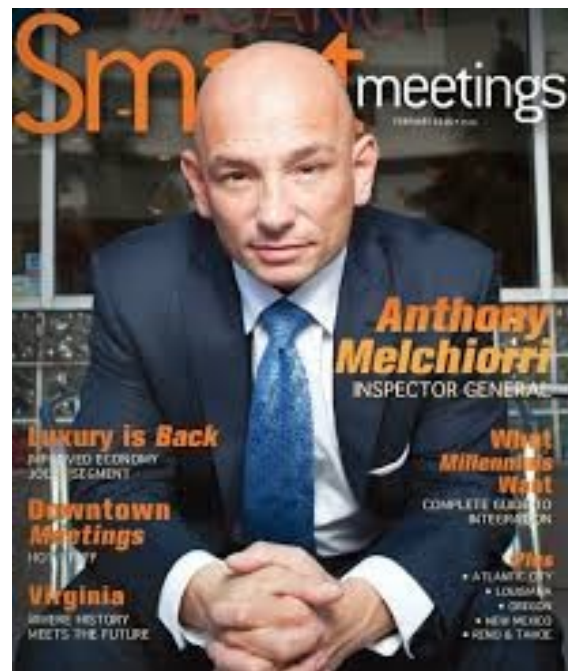
Jurymitglied, Hotel- und Tourismus-Experte Anthony Melchiorri

Noch im Juli erhielten wir die Nachricht, dass wir auf die Shortlist im Bereich Spa, Fitness & Wellness gesetzt wurden und dass nun das Research-Team mit der Auswertung aller vorliegenden Quellen, Medienberichte, Kundenbewertungen, der bereits gewonnenen Auszeichnungen und den eingesandten Fotos beginnen würde. Es werde ein „supporting file“ erstellt, der uns aber nicht zur Kenntnis gegeben werde, sondern