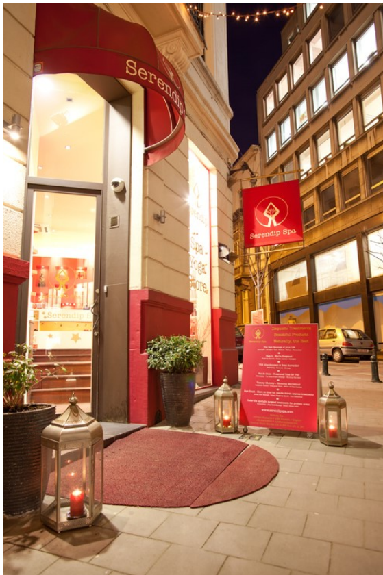
„Spa of the Year“ im Vorjahr: Serendip Spa & Yoga, Bruxelles, Belgium